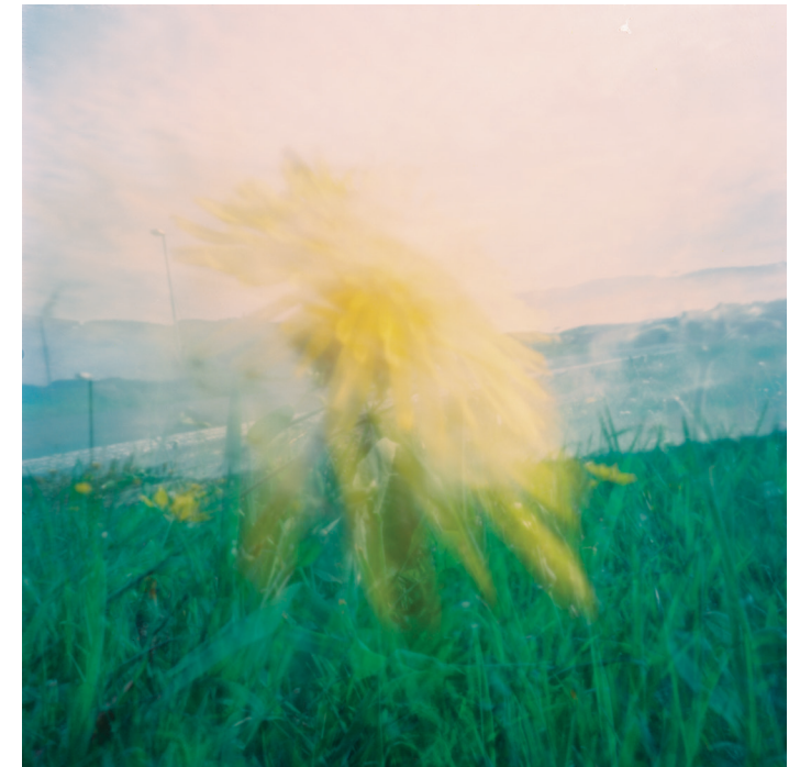
Gelbe Blume

Alle Zeit- und Ortsangaben sind vorbehaltlich; bitte die aktuellen Termine auf unserer Website überprüfen.